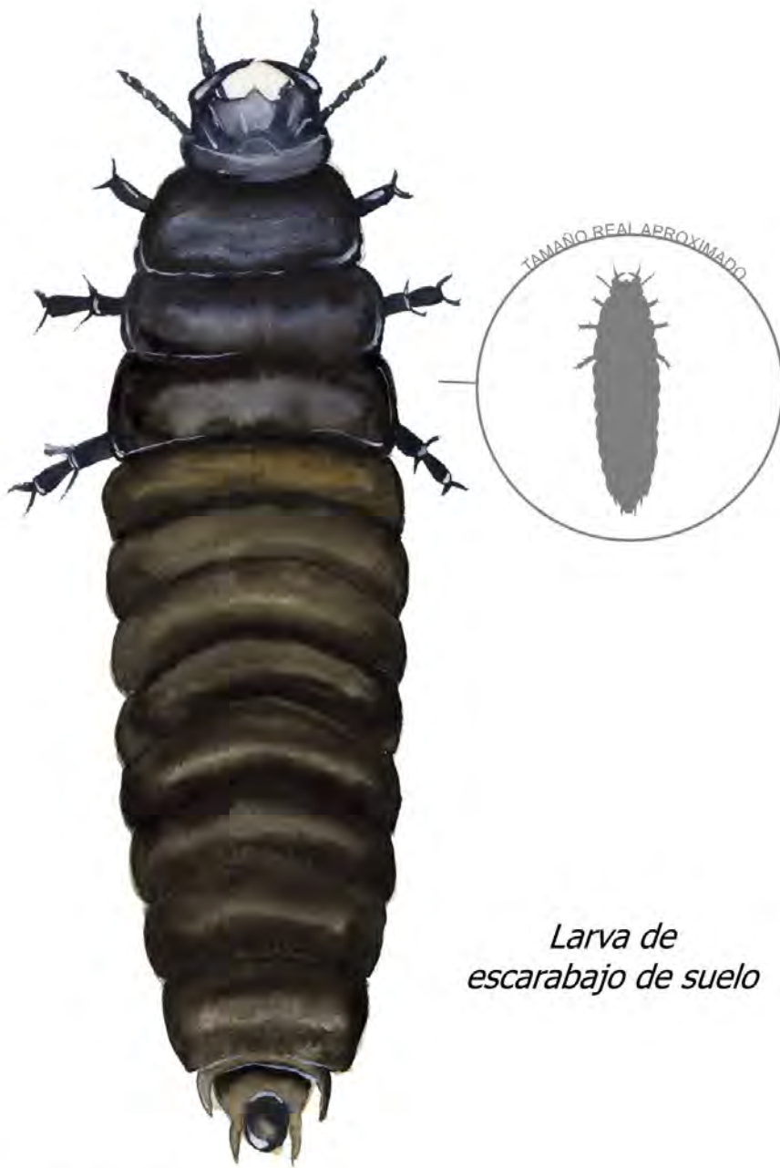
Larva de escarabajo de suelo