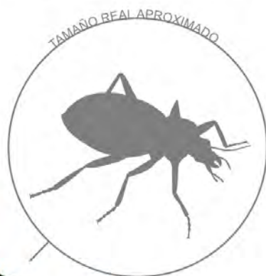
Adulto de una especie con color metalizado