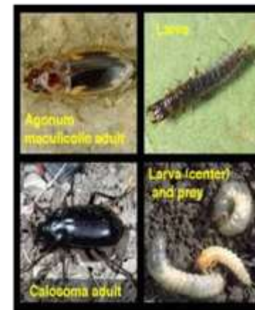
Ciclo de vida del escarabejo común de tierra